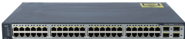
Image IPB Catalyst 3750 48 10/100 4 SFP