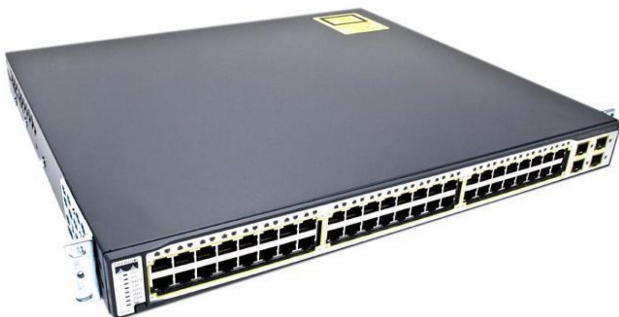
Image IPB Catalyst 3750 48 10/100/1000T 4 SFP